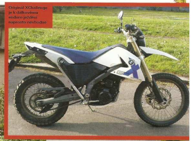
Original XChallenge je křákovitým endurom předevzato naprosto nevhodně

H ned na začátek se nabízí první otázka. Proč zrovna tohle BMW? Odpověď není zase tak složitá: „Chci jsem lehké enduro, nevadí mi jednoválec. Předpokládám, že na motorce bude jezdit také moje drahá polovička a nechtěl jsem jí trápit velkým GS. Další podmínkou byl nový stroj, takže Dakar nepřicházel v úvahu. No a u KTM