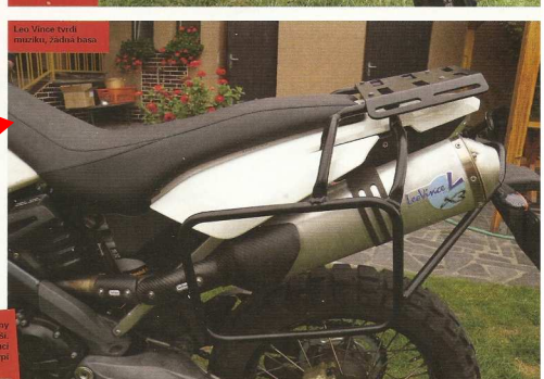
Leo Vince vrtá řetězu, zadná basa