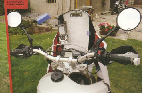
Za tahe kapotu ze křídla vyjde i menší televize