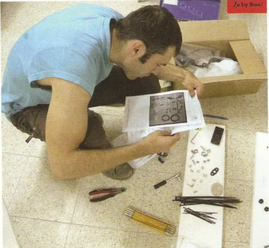
Ze by kšó?