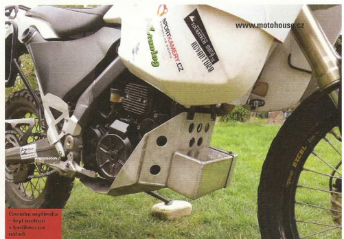
Gemelná myšlenka - kryt motoru a korběm se balíček

Zbyvaly už jen detaily, a to dílaření malá, ale jít to celé dolehdit, vypracovat, nalakovat a silicovat dohromady. Jak se přestavba BMW G 650 XChallenge na dálkový expres povedla, se dozvíme, až se Radek vrátí ze své expedice, na dálku zatím hlásí, že vše funguje bez problémů. Rozhodně si zaslouží body za odvalu. Nechtěl jenom kroužit hlavou nad tím, že na trhu není motorka, kterou by na svou cestu potřeboval, ale nechtěl se postavit si jí na dobrém základu sám. A to nás baví. ■