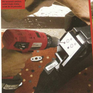
Při montáži vesleč nádrž bylo třeba vrtat do teplotovky