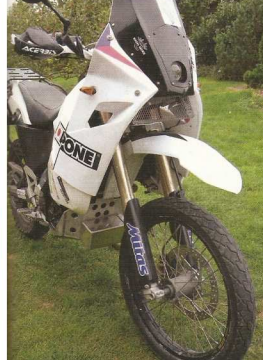
Kapotáž Kapey Barovské slůž. Chromová zastavka obou značek trpí