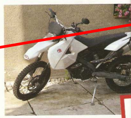
V dílně A-Z tuningu gudebár místo zadního sedla extra nádobky na olej i